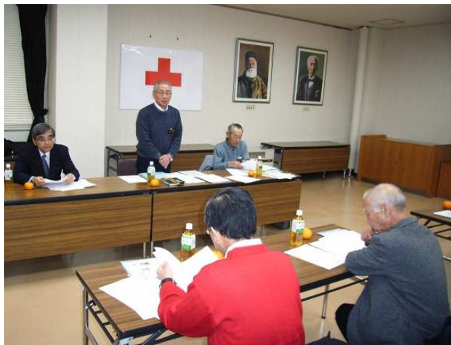
▲21 人が出席したクラブ代表者・支部役員会議